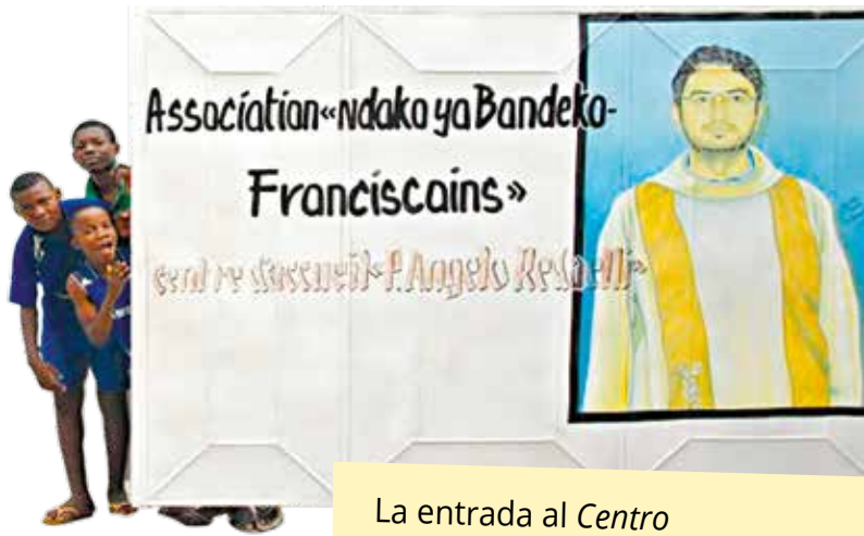
La entrada al Centro dedicado al Padre Angelo

P.S. Le agradezco de antemano su generosidad, también en nombre de todos los pequeños que, gracias a usted, encontrarán por fin un hogar seguro donde crecer.