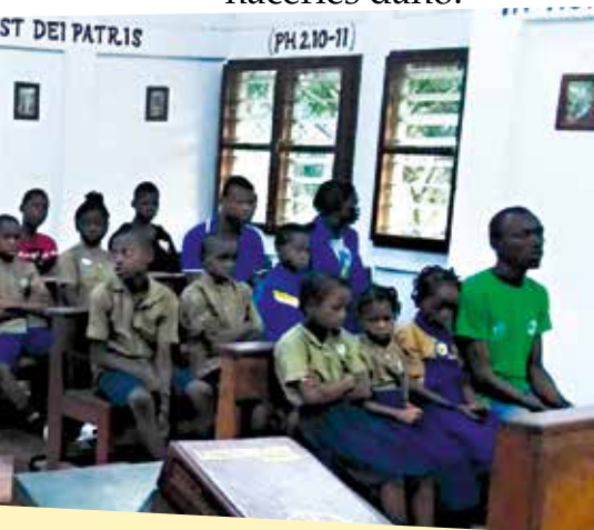
Un momento de oración juntos en la capilla del Centro.