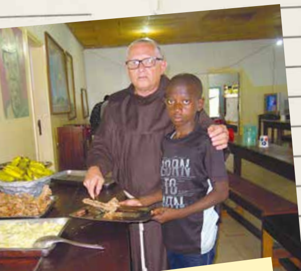
Los niños y jóvenes comen juntos con los hermanos en el refectorio.

19 h En la capilla rezamos juntos nuestras oraciones y luego... ¡todos a la mesa! Por lo general, nuestra excelente cocinera prepara la comida, pero los domingos, que es su día libre, los mayores cocinan para todos y cuidan a los pequeños. Para ellos es una oportunidad de crecer y aprender a vivir juntos como hermanos y hermanas!