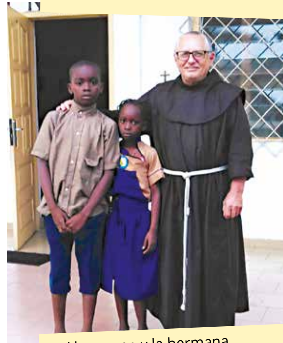
El hermano y la hermana recibidos en el Centro durante el confinamiento.