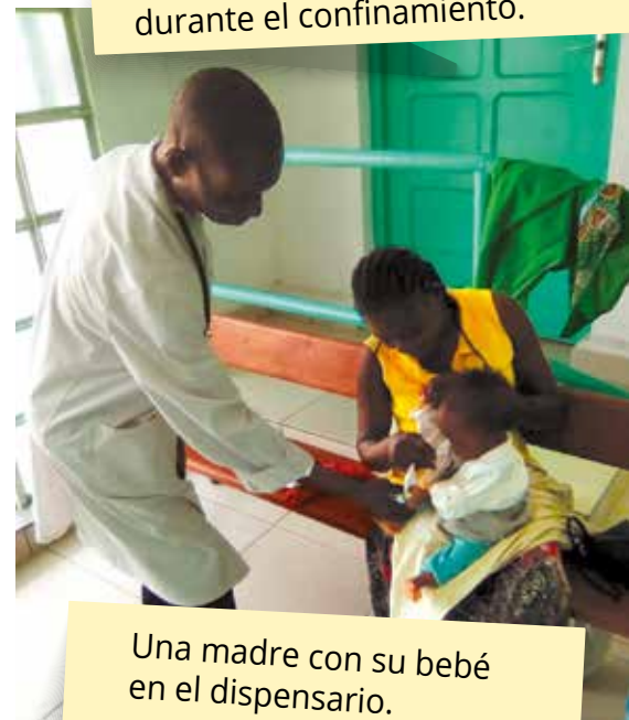
Una madre con su bebé en el dispensario.

Tu generosidad es hogar, cuidados y esperanza para los niños solos del Congo Brazzaville